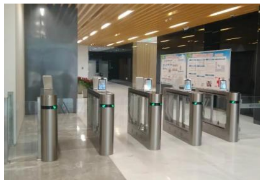
人员通道 (含卡、身份证、人脸验证)